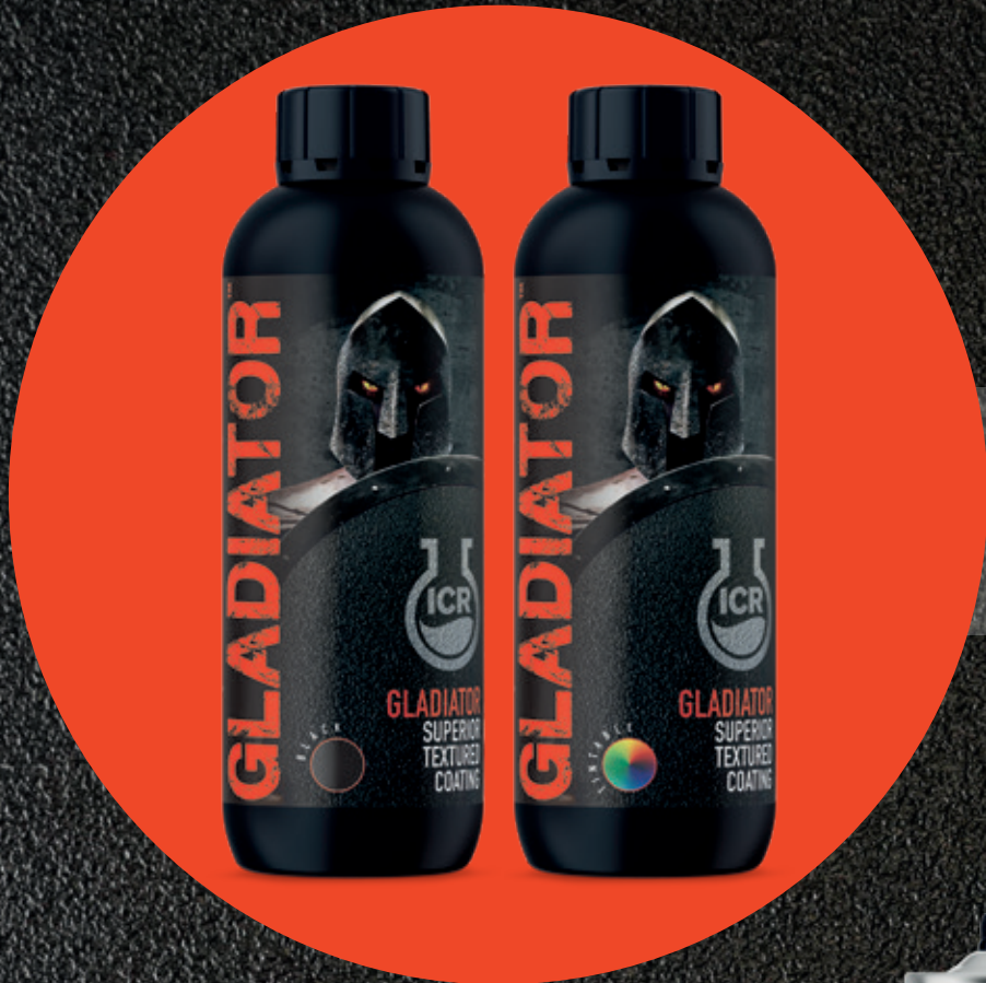
GLADIATOR Покрытие Black и Tintable 750 мл