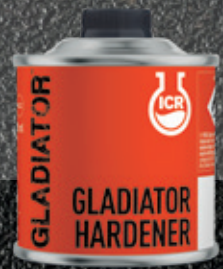
GLADIATOR Отвердитель 250 мл и 1 л